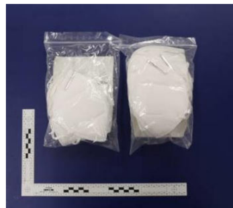
Verpackung / Packaging