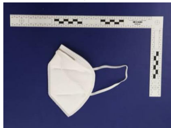
Seitenansicht / Side view