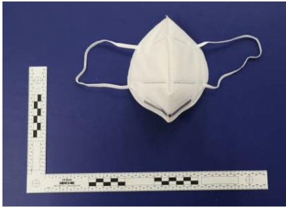
Frontansicht / Front view