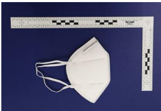
Seitenansicht / Side view