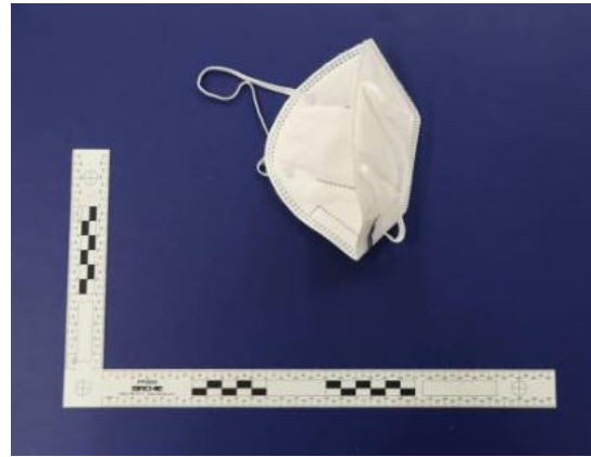
Innenansicht / Inner view