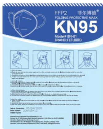
Verpackung / Packaging

Die folgende Maske wurde geprüft / The following mask was tested: